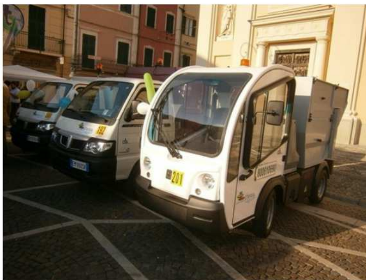
La nuova flotta green;

Veicoli elettrici oppure ad alimentazione metano e b-fuel